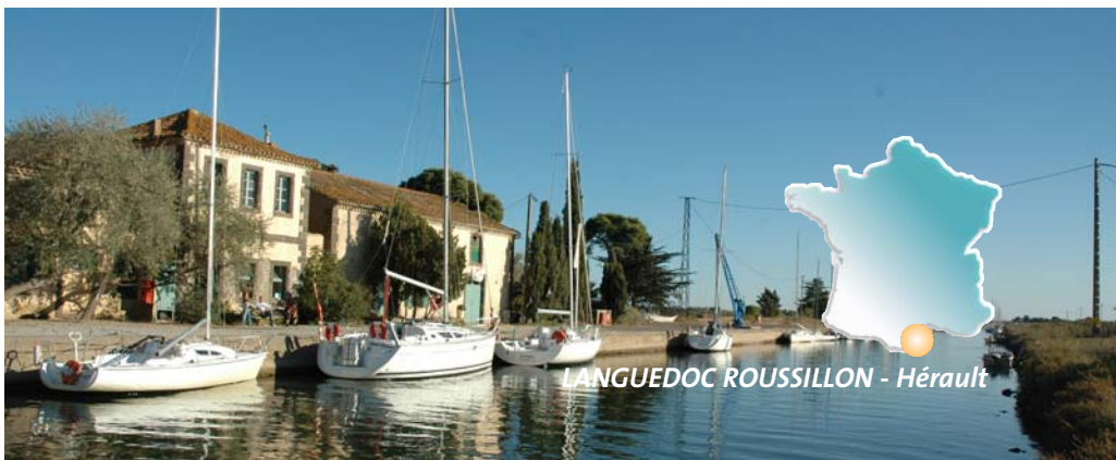
LANGUEDOC ROUSSILLON - Hérault