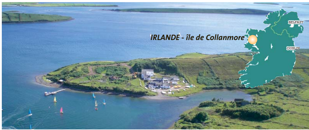
IRLANDE - île de Collanmore