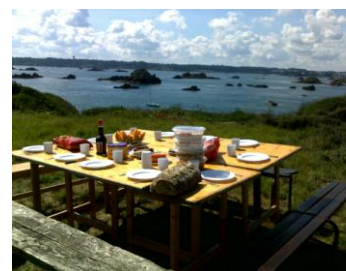
La terrasse de l'Île Verte

Réfléchir, échanger et discuter ensemble sur les objectifs de l'association Se familiariser et apprendre l'entretien et le maniement des bateaux Entretien et embellir les sites de Paimpol, de Coz Castel et de l'Île Verte pour accueillir les futurs stagiaires.