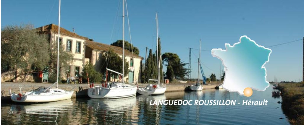
LANGUEDOC ROUSSILLON - Hérault